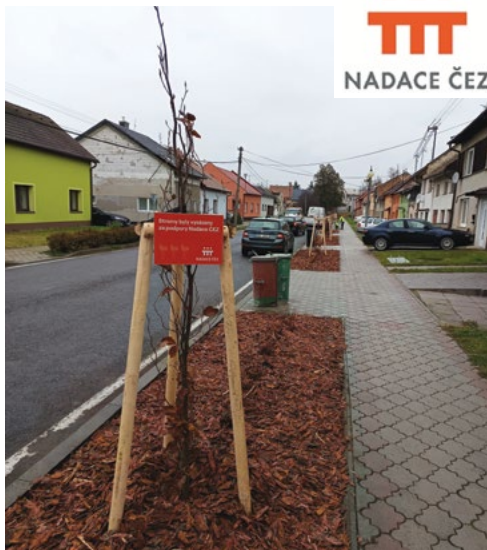
Výsadba stromů za podpory Nadace ČEZ