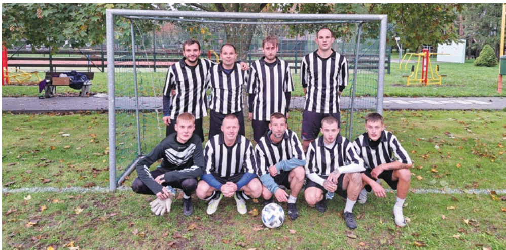
Turnaj v Dřevnovicích z 5. 10. 2024

Termín 19. 10. 2024 Pořadatel: Dřevnovice – Víceměřice (hřiště: Víceměřice)