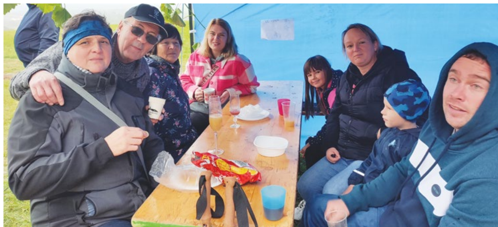
Účastníci na Kozlově