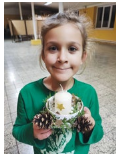
„Tvořilky“ z řad dětí