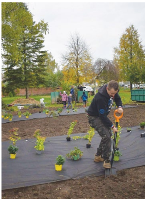
Park v obci