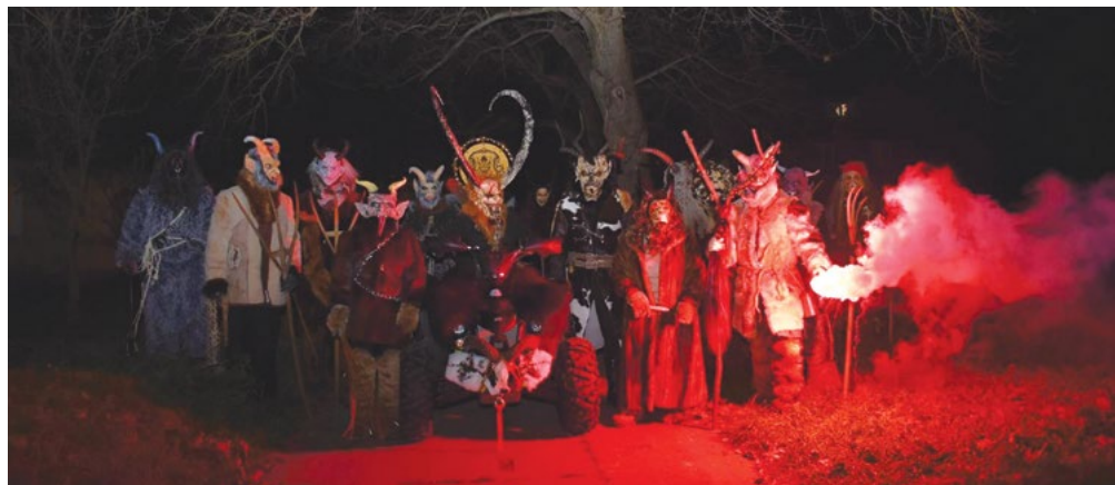
Víceměřický průvod čertů ala Krampus