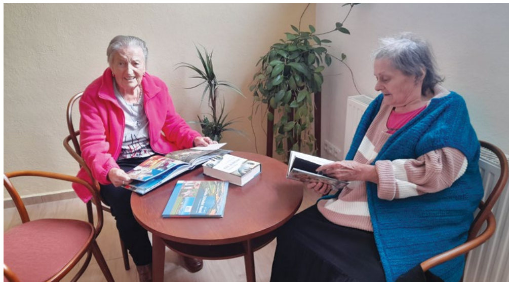
Posezení v Domově