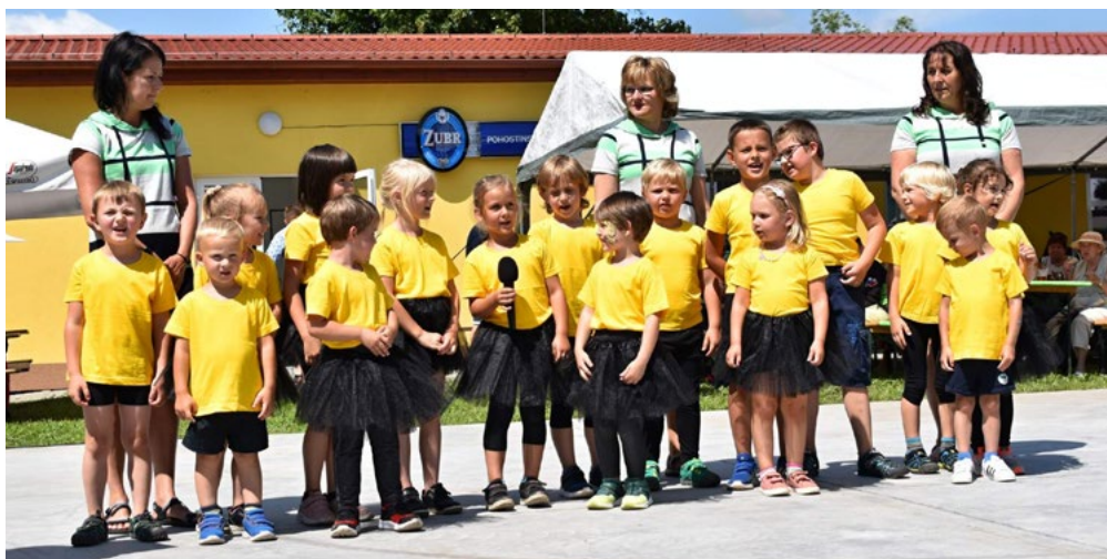
Vystoupení dětí z mateřské školy