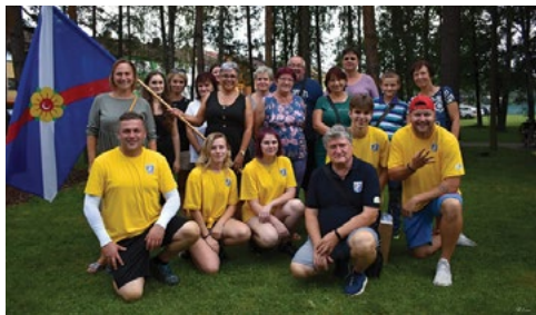
Soutěžní družstvo naší obce