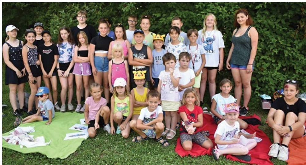
MLádež na projektovém dni – První pomoc