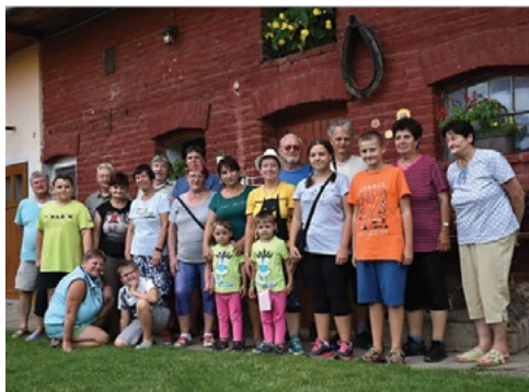
Účastníci akce Prohlídka zahrádek